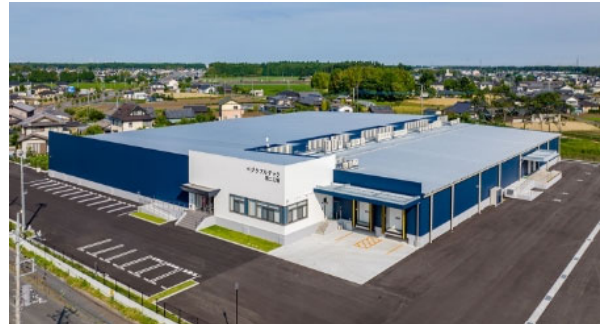
【植物工場の建設事例】