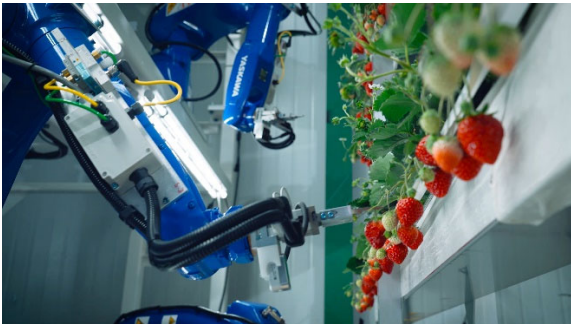
【Oishii Farm 工場内の自動化の様子】

※3. 製造所における製造管理、品質管理の基準のこと。原材料の入荷から製造、最終製品の出荷まで、すべての過程において、製品が「安全」に作られ「一定の品質」が保たれるよう定めている。