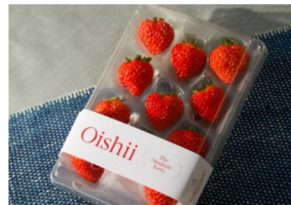
【米国で販売中の商品（いちご）】